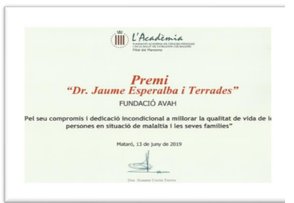
Premi Jaume Esperalba i Terrades 2019 L'Acadèmia de Ciències Mèdiques i dela Salut de Catalunya i Balears Filial del Maresme