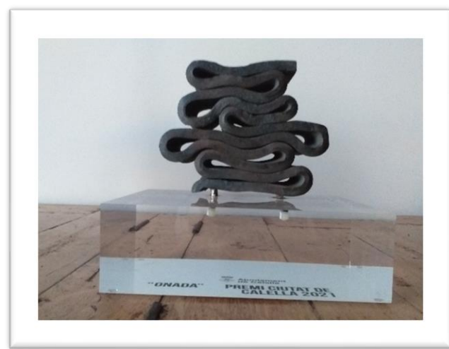
PREMI CIUTAT DE CALELLA ENTITATS 2021